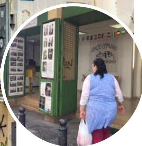
NELLE FOTO In alto, l'ingresso della scuola "Annalisa Durante". Nel tondo, l'ingresso della biblioteca. A fianco, una donna cerca di liberare il marciapiede dai rifiuti ingombranti. Nella foto piccola di pagina 2, l'edificio che sarà ristrutturato per ospitare "la Casa di Vetro"