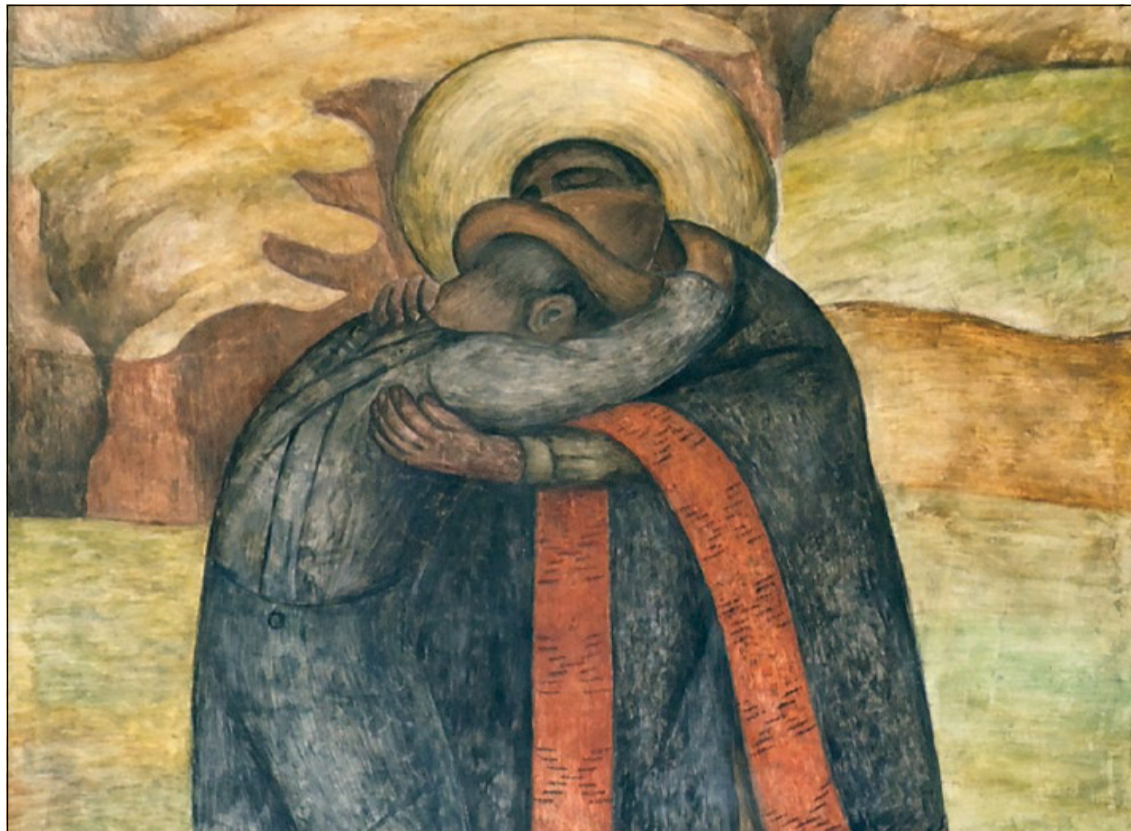
Diego Rivera, «L'abbraccio» (1923)