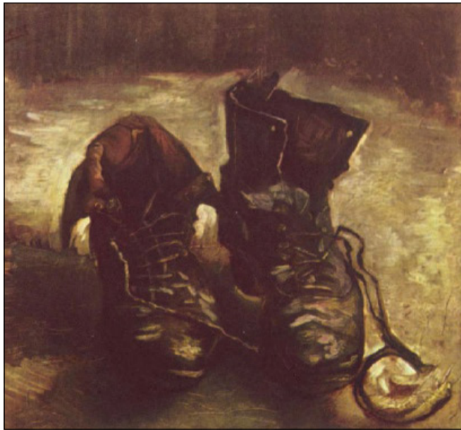
Vincent van Gogh, «Un paio di scarpe» (1886)

tivo della materia, ma fa parte dell'essenza stessa del Pensiero, dell'Idea e dello Spirito. Il divenire allora si configura come il risultato di un processo dialettico. «La dialettica hegeliana – afferma Piccolo – non è altro che la Ragione che si sviluppa, il Concetto che si dispiega, lo Spirito che si manifesta gradualmente. I gradi rispettivi sono propriamente momenti del suo divenire. Queste fasi rappresentano nella loro ascesa la struttura della conoscenza di sé