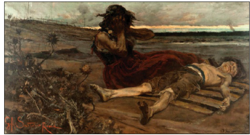
Giulio Aristide Sartorio, «Malaria» (1883)

quella rete in cui ogni cosa è inevitabilmente inserita. Nel momento in cui facciamo di qualcosa l'oggetto della nostra domanda, quella cosa è sottratta allo sfondo indistinto nel quale sarebbe condannata a giacere. Essa, come oggetto della domanda, viene portata in avanti, non è più appiattita sullo sfondo, ma lo trascende, «perché non si identifica più con esso».