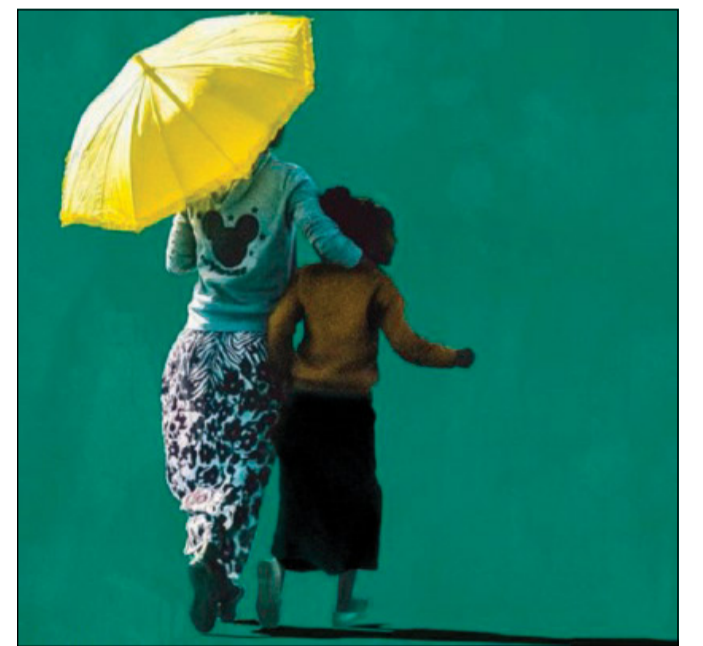
Particolare della copertina

Il titolo del romanzo è legato alle donne coraggiose e forti che compaiono nell'arco del racconto: Nicoletta, Elkelé, Fatima, Agata e tante altre; tutte,