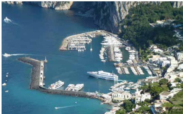
Il porto di Capri ha 300 posti barca e per un ormeggio, in alta stagione, si paga fino a 3.000 euro al giorno.

È anche vero che queste cifre sono state calcolate sulle tariffe applicate in alta stagione e a barche di circa 55 metri, ma di sicuro quest'anno chi decide di visitare le perle del nostro Paese si troverà le tasche un po' più vuote. Ma per chi possiede uno yacht, probabilmente queste cifre sono degli spiccioli.