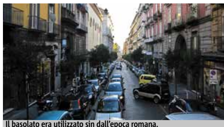
Il basolato era utilizzato sin dall'epoca romana.

NAPOLI - Invece che ricoprire la strada con colate di asfalto, in via Duomo a Napoli si preferiscono i "basoli", le grosse pietre nate dalle eruzioni del Vesuvio. È un ritorno all'antichità, per questa parte del centro, sebbene i lavori siano iniziati giusto un paio di giorni fa. Un tempo vennero eliminate, poiché si sgretolavano sotto le ruote delle carrozze, e richiedevano continue manutenzioni. Oggi, però, questo pro-