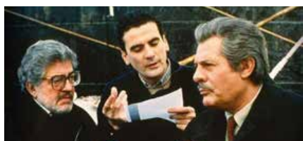
Massimo Troisi tra Ettore Scola e Marcello Mastroianni.

NAPOLI - Per tutti è stato "il Pulcinella senza maschera" o il "comico dei sentimenti", con la sua comicità così napoletana, fatta di espressioni e gestualità. Massimo Troisi è morto il 4 giugno di 25 anni fa, ma ancora oggi tutto il mondo lo ricorda per alcune pellicole senza tempo. È così che la televisione lo ricorda, mandando in onda alcuni dei suoi più celebri film. Su Rete 4 ci saranno "Pensavo fosse amore: ... e invece era un calesse" (domenica alle 21); "Scusate il ritardo" (lunedì alle 0.20); "Le vie del Signore sono finite" (martedì alle 0.30). Su Rai 1, invece, martedì alle 20.30 ci sarà una puntata speciale di "Techetechetè" dedicata a Troisi.