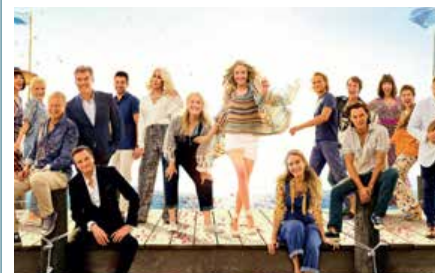
Il 2 giugno sarà proiettato il film "Mamma mia - ci risiamo".

NAPOLI - È stato un momento tanto annunciato e anche molto atteso, ma finalmente è arrivato. L'Ex Base Nato di Bagnoli è finalmente riaperta al pubblico, e lo sarà per i prossimi mesi grazie al ricco programma di eventi teatrali, musicali e gastronomici che caratterizzano la rassegna "Estate a Bagnoli". A inaugurare quest'area culturale sarà il Cinema all'aperto. A partire da domani, infatti, due grandi schermi proietteranno per tutti i week end di giugno e luglio, alle 21, i migliori film della stagione. I primi appuntamenti saranno quelli con "Ant-Man and The Wasp" e "Mamma mia - ci risiamo". La grande protagonista della stagione, tuttavia, sarà la musica grazie agli ospiti che si esibiranno già a partire dai prossimi giorni. Alla fine del mese è atteso Calcutta (il 28), mentre a luglio ci saranno Gazzelle (19) e Carl Brave (23). Ci sarà poi l'aria "Experience", che offrirà un viaggio sensoriale in grado di ricreare le diverse città del mondo.