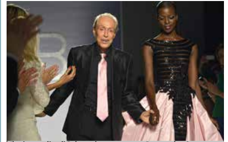
Il primo atelier di Balestra è stato aperto a Roma nel 1961.

NAPOLI - Tra i nomi che hanno reso grande la moda made in Italy c'è quello di Renato Balestra che, con la sua creatività pittoresca e il suo ecletticismo, ha dato vita tanto ad abiti da passerella quanto a costumi per gli spettacoli operistici. Questi sono i nuclei principali della mostra "Celeblueation", inaugurata ieri alla Certosa e Museo di San Martino di Napoli. Sebbene di nascita triestina, lo stilista ha sempre apprezzato Napoli tanto da rivelare che da ragazzo amava questo mare (forse il suo Blu Balestra trae origine proprio da qui). Fino al 18 giugno i visitatori potranno ripercorrere l'evoluzione dello stile del couturier, osservando oltre 250 tra bozzetti, abiti e disegni da lui scelti tra quelli ideati nell'arco della sua lunga carriera. La mostra, inoltre, è composta anche da una sezione inedita, dedicata alle opere realizzate da Balestra durante i suoi esordi, e da uno spazio che affianca i costumi di scena - tra i quali quelli realizzati per "Il Lago dei Cigni" del Teatro dell'Opera di Belgrado.