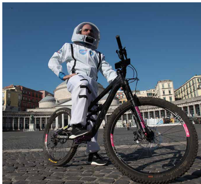
"Con la tua bici puoi andare dove vuoi" è il claim della rassegna, ispirato all'anniversario dell'allunaggio.

Dalle 10.30 fino alle 13, poi, ci saranno una serie di laboratori artistici e scientifici dedicati sempre alle "due ruote". Alle 12.30, alle 14 e alle 19, invece, sono previsti alcuni tour guidati alla scoperta dell'area Ex Nato. Durante la giornata sarà allestita anche l'area "Bici in Mostra", che ospiterà rivenditori e produttori di due ruote, con i loro modelli muscolari, a pedalata assistita, tandem, monopattini, bi-