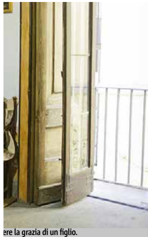
ere la grazia di un figlio.

giare da queste parti). Poi non si può non citare San Gennaro che tutti conoscono per il miracolo della liquefazione del sangue. Ma tutta Napoli è la città del "sangue". Oltre a San Gennaro, ci sono infatti San Giovanni Battista, San Pantaleone, San Lorenzo, Santo Stefano protomartire, Sant'Alfonso de' Liguri, San Luigi Gonzaga, tutte personalità che hanno legato il loro sangue alla città. Le loro piccole ampolle, brandelli di stoffa, denti oppure ossa sono o erano presenti nelle nostre chiese, e regolarmente il liquido diventa rosso in particolari ricorrenze e si liquefa come quello di Gennaro.