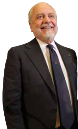
De Laurentiis favorevole al ritorno di Fabio Quagliarella.

all'azzurro nelle scorse settimane. La Sampdoria sarebbe tutt'altro che favorevole a cedere il capocannoniere del campionato, ma l'amore di Fabio per il Napoli non è un mistero, e potrebbe fare la differenza. Malgrado gli screzi con la curva, in molti in città sognano di trattenerlo Insigne per ammirarlo in campo insieme a un altro figlio di Napoli come Quagliarella.