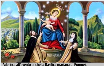
Aderisce all'evento anche la Basilica mariana di Pompei.

Nella notte tra sabato e domenica i luoghi più sacri del territorio napoletano si apriranno ai fedeli per la "Notte dei santuari", un momento voluto dalla Cei per avvicinare i fedeli alla parola del Signore. Tra i luoghi che aderiscono all'iniziativa c'è il Santuario della Madonna dell'Arco, nell'omonimo quartiere del Comune di Sant'Anastasia. Qui le luci del luogo sacro resteranno accese domani fino a tarda sera; alle 21.30 partirà la processione da piazza della Madonna verso il Santuario. Dopo l'accensione della lampada, intorno alle 22.30 i giovani racconteranno la storia del culto della Madonna dell'Arco. Seguiranno eventi alle 23 con l'adorazione eucaristica intorno alla mezzanotte. L'appuntamento andrà avanti tutta la notte, fino alla celebrazione eucaristica delle 7 di domenica. Anche la Basilica mariana di Pompei aderisce all'iniziativa accogliendo i visitatori a lume di candela. L'appuntamento è alle 21.30, in piazza Bartolo Longo, con l'animazione a cura della Corale Regionale del Rinnovamento nello Spirito. Poi, l'accensione della lampada Locus Lucis all'ingresso del Santuario. Alle 22.30, ci sarà il concerto "Note di Luce" dell'organo monumentale del Santuario. "In preghiera con Maria, trasparenza della luce divina" sarà invece il momento culminante della serata.