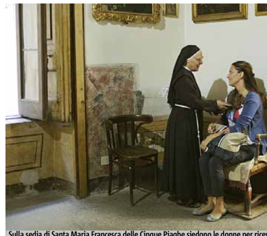
Sulla sedia di Santa Maria Francesca delle Cinque Piaghe siedono le donne per ricevere

to di decine di santi, da San Tommaso d'Aquino, passando per Sant'Antonio Abate, fino a Rita da Cascia. Nonostante sia passato mezzo millennio da questo vero e proprio "boom", fede e venerazione a Napoli sono oggi più vive che mai, tanto che ogni anno si rinnova il rito della processione delle statue dei santi patroni che sfilano, portate a spalla dai fedeli per le vie del centro antico della città. Per i napoletani credenti, i santi svolgono il ruolo fondamentale di intercessori presso Dio e di veri confidenti, tanto che un cartello all'interno della San-