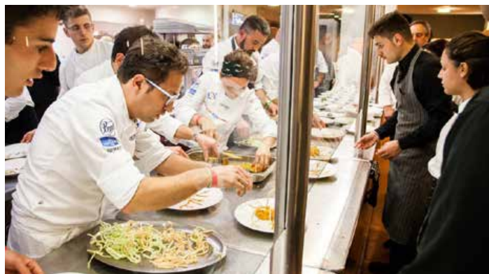
Grande parata di pietanze da leccarsi i baffi per tre giorni a Vico Equense.

re un carnet di cinque assaggi. Oltre a questo evento principale, che si svolgerà questa domenica a partire dalle 19.30, il programma prevede anche due cene di gala. Lunedì 3, sempre dalle 19.30, ci sarà la "Cena delle Stelle" una ventina di chef pluristellati - tra i quali ci saranno anche Antonino Cannavacciuolo e Bruno Barbieri - saranno ai fornelli del ristorante "Pizza a Metro da Gigino - L'Università della pizza", per preparare una cena speciale per duecento commensali. Martedì 4, invece, la rassegna si concluderà alla Marina D'Aequa, con "Il Cammino di Seiano" dove, a partire dalle 19.30, si potrà fare una passeggiata alla scoperta della gastronomia locale, esaltata da chef stellati e da stand di street food. In più, per concludere in bellezza, si potrà godere della pasticceria di alcuni dei maestri più rinomati d'Italia.