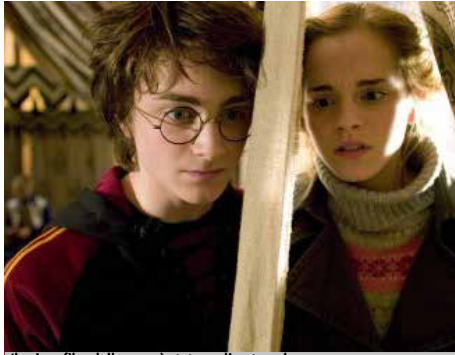
Il primo film della saga è stato realizzato nel 2001.

"Il Torneo Tremaghi + Uno" arriva al Vomero e sfida tutti i potteriani a colpi di magia. Il vincitore volerà agli studios di Harry Potter