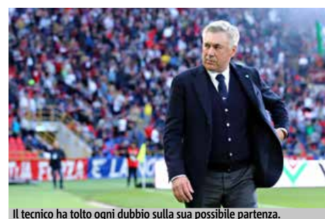
Il tecnico ha tolto ogni dubbio sulla sua possibile partenza.