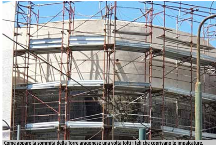
Come appare la sommità della Torre aragonese una volta tolti i teli che coprivano le impalcature.

Ma la risposta da parte della società che si è occupata dell'intervento di restauro non si è fatta attendere. L'azienda ha parlato attraverso