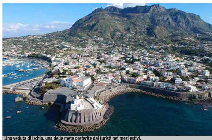
Una veduta di Ischia, una delle mete preferite dai turisti nei mesi estivi.