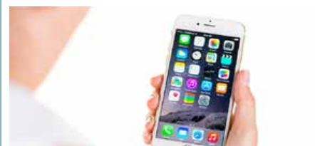
L'app permette anche di spostare le prenotazioni.

NAPOLI - Se uno dei maggiori problemi di chi cerca di prenotare un esame medico è quello delle lunghe code di attesa, d'ora in poi c'è la soluzione. Da domani, infatti, l'Asl Napoli 1 Centro renderà attiva la nuova app "e-CUPT", che permetterà di prenotare ogni tipo di visita specialistica, utilizzando solo lo smartphone o il tablet. La si potrà scaricare gratuitamente sia per i dispositivi Android che sui sistemi iOS. Per entrare in lista sarà sufficiente inserire i propri dati e il codice impegnativa (NRE o SAR). Dopodiché basterà scegliere tra le date disponibili ed eventualmente anche la struttura nella quale farsi visitare. Si tratta dunque di un cambiamento radicale che, se funzionante, andrebbe a limitare al massimo i disagi degli utenti.