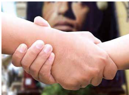
La Onlus sopravvive grazie a volontari e donazioni