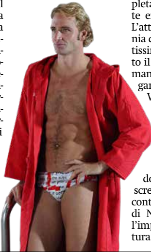
Il campione olimpico Massimiliano Rosolino è uno degli ambassador dell'evento.

corsi mirati alla partecipazione dei dei giovani detenuti agli eventi sportivi delle Universiadi. Per questo gli ambassador, Massimiliano Rosolino e Patrizio Oliva, incontreranno i ragazzi degli istituti penali di Nisida a Napoli e di Airola a Benevento per raccontare la loro esperienza da campioni per essere da esempio in vista del loro reinserimento sociale.