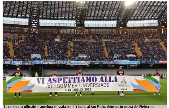
La cerimonia ufficiale di apertura è fissata per il 3 luglio al San Paolo, chiusura in piazza del Plebiscito.

Worldwide Show - verrà trasmessa in mondo visione e prevederà la partecipazione di ben 1.500 giovani comparse. Stando alle prime indiscrezioni l'evento racconterà la vitalità tipica di Napoli, celebrando l'importanza della cultura sportiva per i gio-