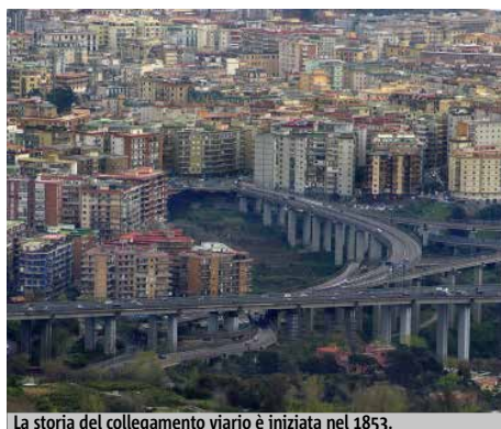
La storia del collegamento viario è iniziata nel 1853.