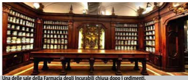
Una delle sale della Farmacia degli Incurabili chiusa dopo i cedimenti.

Il nuovo spazio espositivo, ospitato nei locali al piano terra di Palazzo Reale, sarà un piccolo "Museo della storia sanitaria di Napoli", una sezione organica della nuova zona espositiva destinata ad ospitare una mostra permanente sulla storia della città. Il pro-