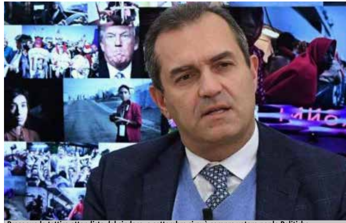
Prosegue la tattica attendista del sindaco, a settembre si può sempre votare per le Politiche.

so domenica M5s: persi sei milioni secchi di voti nel giro di un anno. In più ieri ha girato ancora di più il coltello nella piaga: «Non credo alla piattaforma Rousseau e non le riconosco caratteristiche di trasparenza, pluralità e di pensiero diffuso e libero che è proprio di una democrazia diretta e partecipativa - ha detto in riferimento al voto dei militanti sulla sorte di Luigi Di Maio come capo politico -. Mi piace molto il filosofo Rousseau, ma non la piattaforma». Ma si sa, in politica la parola non è incisa nella pietra, e de Magistris potrebbe ripensarci. Il sindaco intanto procede con il suo mantra: una «coalizione regionale larga, ma chiara, alternativa a Salvini e a De Luca». Second-