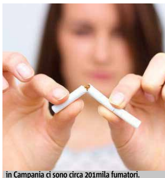
In Campania ci sono circa 201 mila fumatori.

Circa un quinto dei tabagisti 18-69enni è un forte fumatore (un pacchetto o più al giorno), mentre solo il 2% è un fumatore occasionale (meno di una sigaretta al giorno). Purtroppo l'abitudine al fumo inizia precocemente: dall'indagine regionale sugli adolescenti emerge che fuma sigarette l'1% degli undicenni, il 5% dei 13enni e il 29% dei