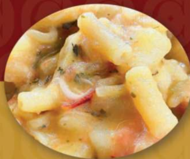
Pasta e patate con provola