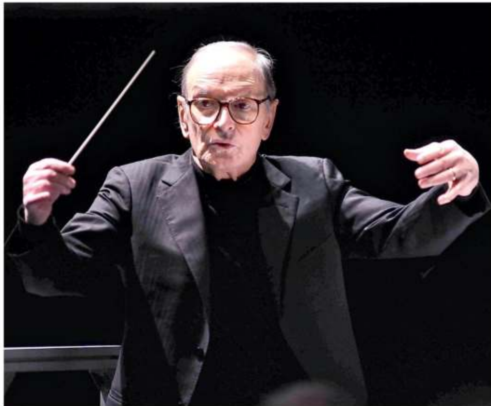
▲ Compositore Ennio Morricone

Sabato alle 21, concerto dei Neri per Caso al Teatro Mediterraneo alla Mostra d'Oltremare, organizzato dall'Ortopedia Meridionale di Salvio Zungri, per il sostegno a Medici senza frontiere.