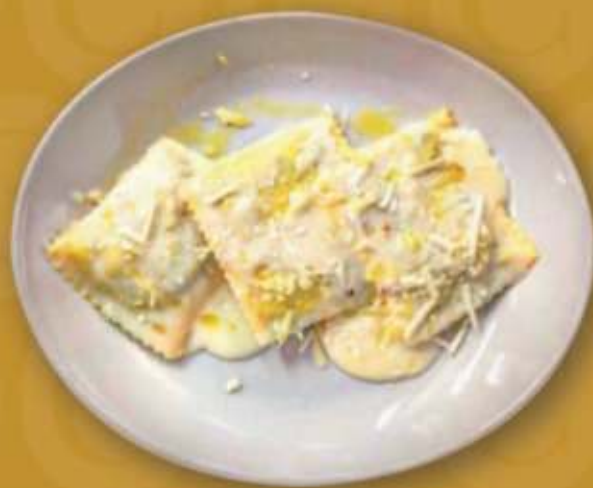
Ravioloni ripieni di ricotta di bufala e spinaci