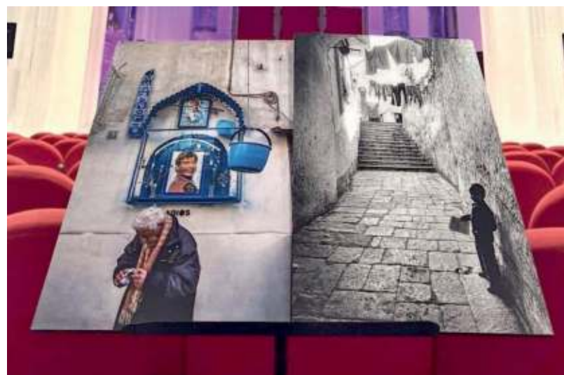
▲ Immagini Alcune delle foto in mostra

L'esposizione rappresenta «un ponte tra due visioni artistiche che, pur partendo da prospettive diverse, si incontrano nel cuore pulsante di Napoli, offrendo al pubblico un'esperienza indimenticabile».