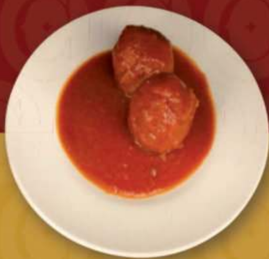
Polpette al ragù napoletano