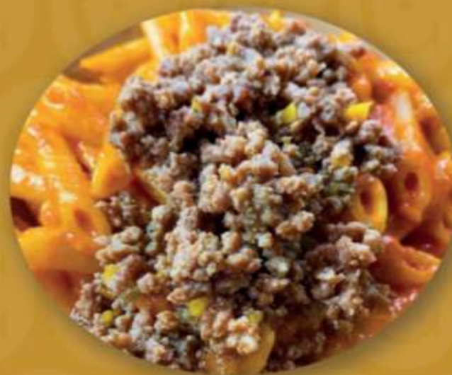
Pennette alla Carmine

Vieni a trovarci per scoprire tutti i nostri piatti