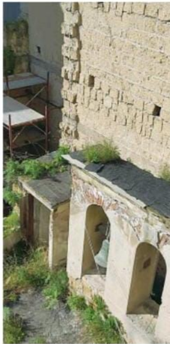
quel che resta dell'interno dell'antica chiesa

La chiesa di Santa Maria a Piazza è una delle più antiche di Napoli e si trova in via Vicaria Vecchia a Forcella. Il toponimo è dovuto a quella che al tempo era una delle maggiori piazze di Napoli. Di notevole importanza storica e architettonica era il campanile che risaliva al X secolo, ma che fu abbattuto agli inizi del Novecento nell'ambito dei lavori del Risanamento. La facciata, di forma quadrata, presentava delle finestre ai lati del portale e un sottoparco. All'interno sono custoditi due preziosi crocifissi lignei.