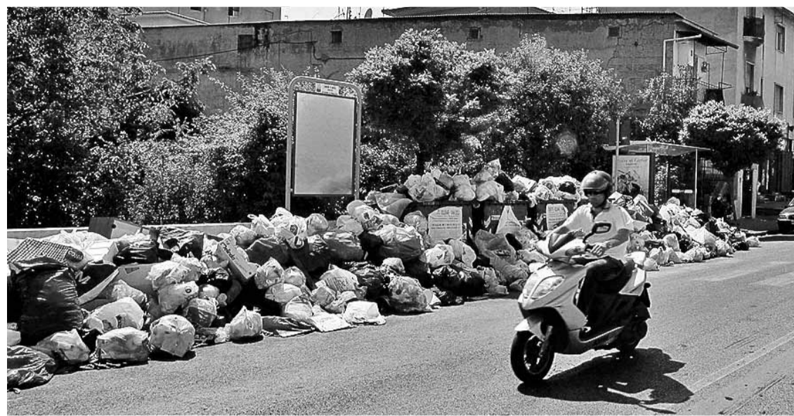
Versunken im Dreck: Der Krankenhausbezirk Neapels wartet auf die Müllabfuhr – weil die Mafia im Abfallgeschäft mitmischt

Verwahrlosung und Gewalt regieren Neapel. Mitten im historischen Zentrum der Stadt werden