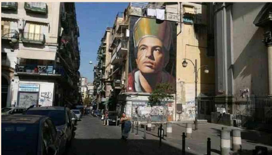
In foto il quartiere di Forcella a Napoli